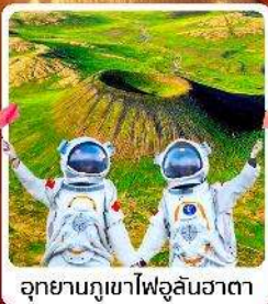
อุทยานภูเขาไฟอูลันฮาตา