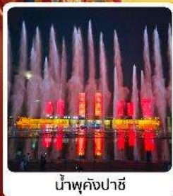
น้ำพุคังปาซี

● โอโล่ เป็นทราseyเสียงชาวมองโกลแห่งท้องถิ่นระดับ 5A ของจีน ภูเขาไฟอูลันฮาตา น้ำพุคังปาซี น้ำพุที่สูงที่สุดในเอเชีย