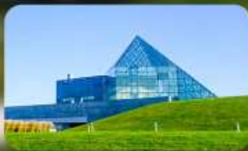
Glass Pyramid HIDAMARI