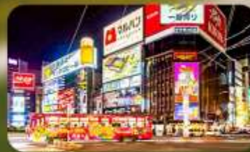
ซุปป์ิงย่านซุซุกิโนะ