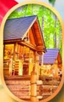
บึงเทิลเกอเรส