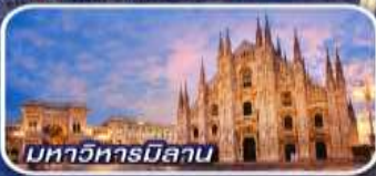
มหาวิหารมิลาน