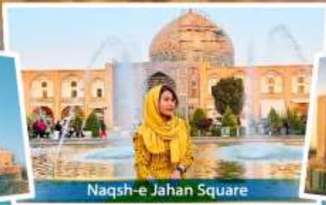
Naqsh-e Jahan Square