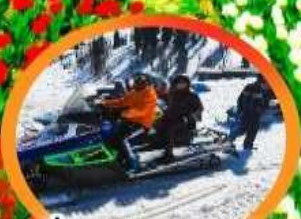
ขี่ SNOW MOBILE