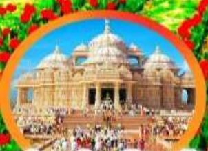
วิหารอินดูอัมมาตัม