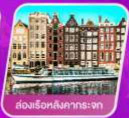
ล่องเรือหลังคากระซก