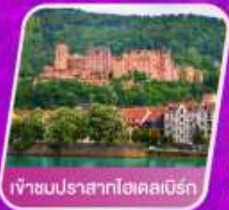
เจ้าชมนปราสาทไฮคสเบิร์ก

เที่ยวเทศกาลดอกไม้เคอเคนฮอฟ ชมแคว้นอาลซัส หมู่บ้านสวยที่สุดในฝรั่งเศส เยือนเมืองมรดกโลก