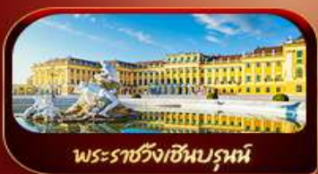
พระราชวังเซนต์มาร์ติน

ฟรีแอด 29 พ.ค.-05 มิ.ย.69 / 02-19 มิ.ย.69 / 21-28 ก.ค. 69 05-12 ส.ค. 69 / 16-23 ก.ย.69