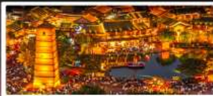
เมืองโบราณลั่วหยี่