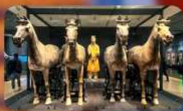
สุสานทหารจีน