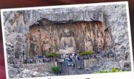
ถ้ำผาหลงเหมิน