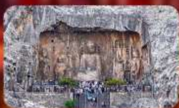
กำแพงหลงเหมิน