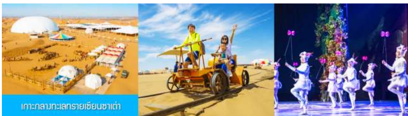
เกาะกลางทะเลทรายเข็มนาเต่า