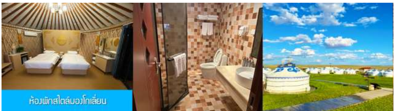
ห้องพักสไตล์มองโกลเลียน