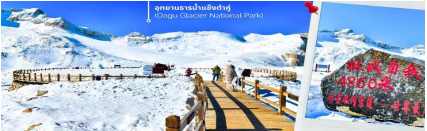
การตกและความหนาวของหิมะขึ้นอยู่กับสภาพอากาศ

จากนั้นนำท่านเดินทางสู่ เมืองเฮยฮุย (ใช้เวลาเดินทางประมาณ 2 ชั่วโมง)เพื่อเดินทางไปยัง อุทยานธารน้ำแข็งต้ากู่ปิงชว่น(รวมกระเช้าขึ้นลง) ต้ากู่ปิงชว่น หรือ Dagu Glacier National Park เป็นธารน้ำแข็งกลาเซียร์ที่สวยงามที่สุดแห่งหนึ่งของโลก และเป็นสถานที่ท่องเที่ยวระดับ 4A ของจีน ตั้งอยู่ที่เมืองเฮยฮุย ในมณฑลเสฉวน ห่างจากเมืองเฉิงตูประมาณ 300 กิโลเมตร ถือเป็นธารน้ำแข็งที่อายุน้อยที่สุด ที่ตั้งอยู่ในระดับความสูงที่ต่ำที่สุด และอยู่ใกล้กับเมืองมากที่สุดในบรรดาธารน้ำแข็งทั้งหมด โดยอยู่สูงจากระดับน้ำทะเลประมาณ 3,800-5,100 เมตร จุดสูงที่สุดที่นักท่องเที่ยวสามารถขึ้นไปได้จะอยู่ที่ 4,860 เมตร