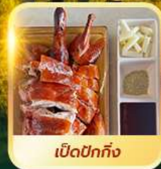
เบ็ดปักกิ้ง