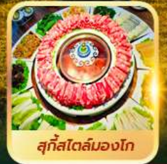
สุกีสโตลิมองโก