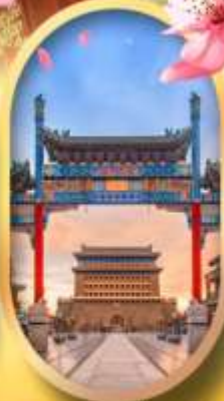
ถนนคนเดินเจียมเหมิน