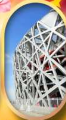
ผ่านชมสนามกีฬาโอลิมปิก