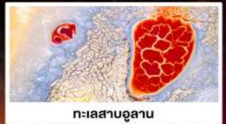
ทะเลสาบอูลาน