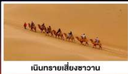
เป็นทรายเสี่ยงชาวน