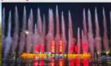
น้ำพุคังปาซือ