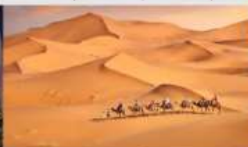
ทะเลทรายเสียงชวาน