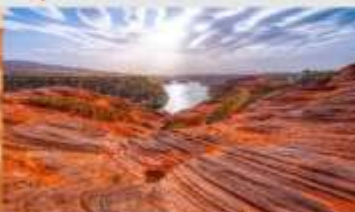
อุทยานหุบเขาคีลิน

*ทางบริษัทฯ ขอสงวนสิทธิ์ในการสืบโปรแกรมทัวร์ตามความเหมาะสมขึ้นอยู่กับสถานการณ์ทำงาน โดยค่าใช้จ่ายผลประโยชน์ของลูกค้าเป็นสำคัญ