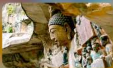
ฆาตินแกะสลักต้าจู้