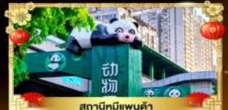
สถานีหมีแพนด้า