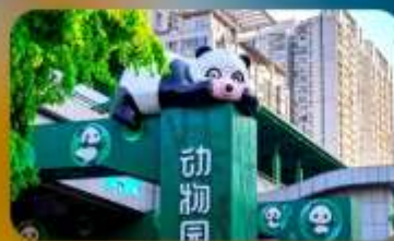
สถานีหมีแพนด้า