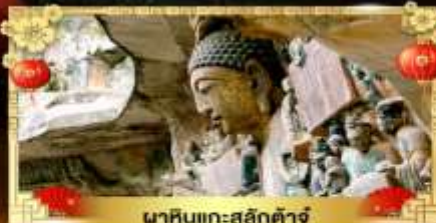
นาหินแกะสลักต้าจู่