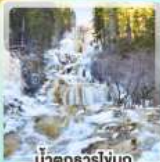
น้ำตกธารไถ่บุญ