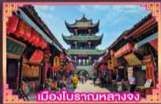
เมืองโบราณหลวงจง