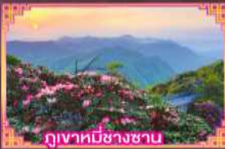
ภูเขาหมีขาซาน