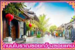
ถนนโบราณซอยกว้างซอยแคบ