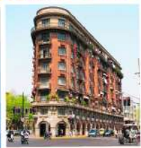
ถนนอุคัง