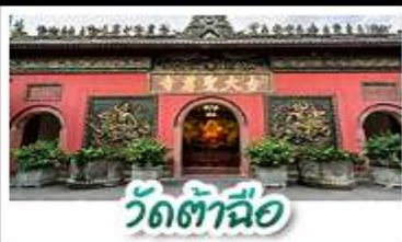
วัดต้าซือ