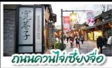
ถนนควนโจ้วเซียงจื่อ