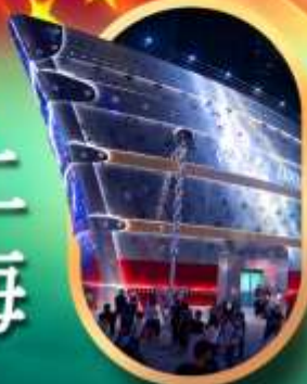
เรือคอะหลุยส์