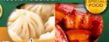
พิเศษ เสี่ยวหลงเป่า หมูแดงพอ เดินทาง ม.ค. - มิ.ย. 69