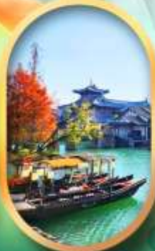
เมืองโบราณผู้หยวน