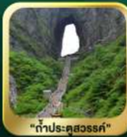
"กำประตูละออง"