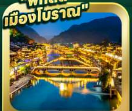
"เมืองโบราณเฟิ่งหวง"