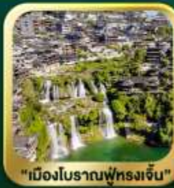
"เมืองโบราณฟูหลงเจิน"