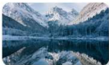
ปี้ฝิงโกว