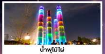
น้ำพุไม่ไผ่