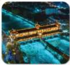
"สะพานหมานเจียว"