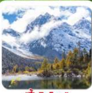
"ปี้เผิงโกว"