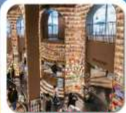
"ห้องสมุดจงซูเก๋"