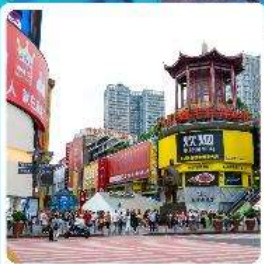
ถนนหวงซิงลู่