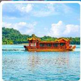
ล่องเรือทะเลสาบหลิวยวู่