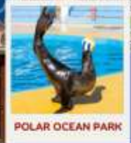
POLAR OCEAN PARK