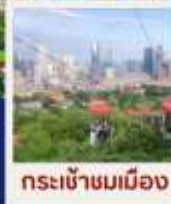
กระเช้าชมเมือง