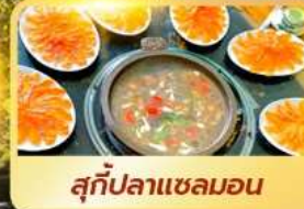
สุกี้ปลาแซลมอน