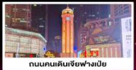
ถนนคนเดินเจี๋ยฟางเป่ย์