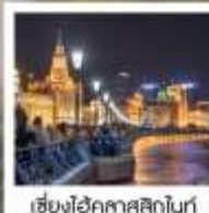
เซี่ยงไฮ้ คคลาศสิกไนท์