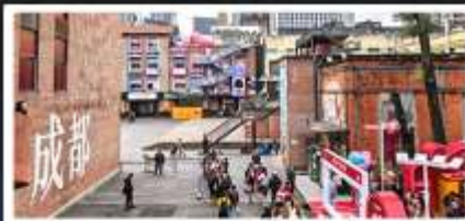
ตงเจียวจื่อ