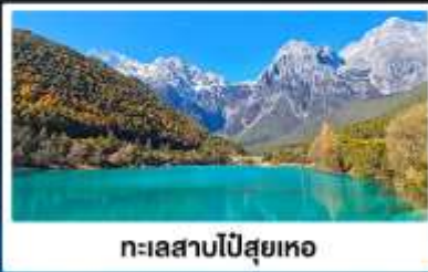
ทะเลสาบไป๋สือเหอ