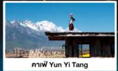
คาเฟ่ Yun Yi Tang