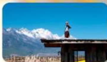
กาแฟ Yun Yi Tang