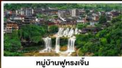
หมู่บ้านฟุ่หลงเจิน