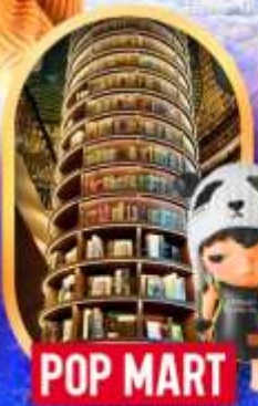
POP MART หอสมุดจงซูเก๋อ