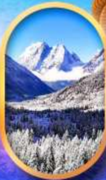
อุทยานสี่ครุฑ