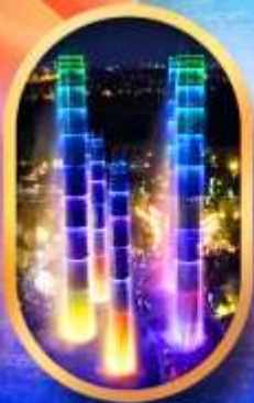
SKP Global Center