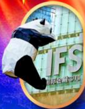
IFS หมีแพนด้าป็นตึก