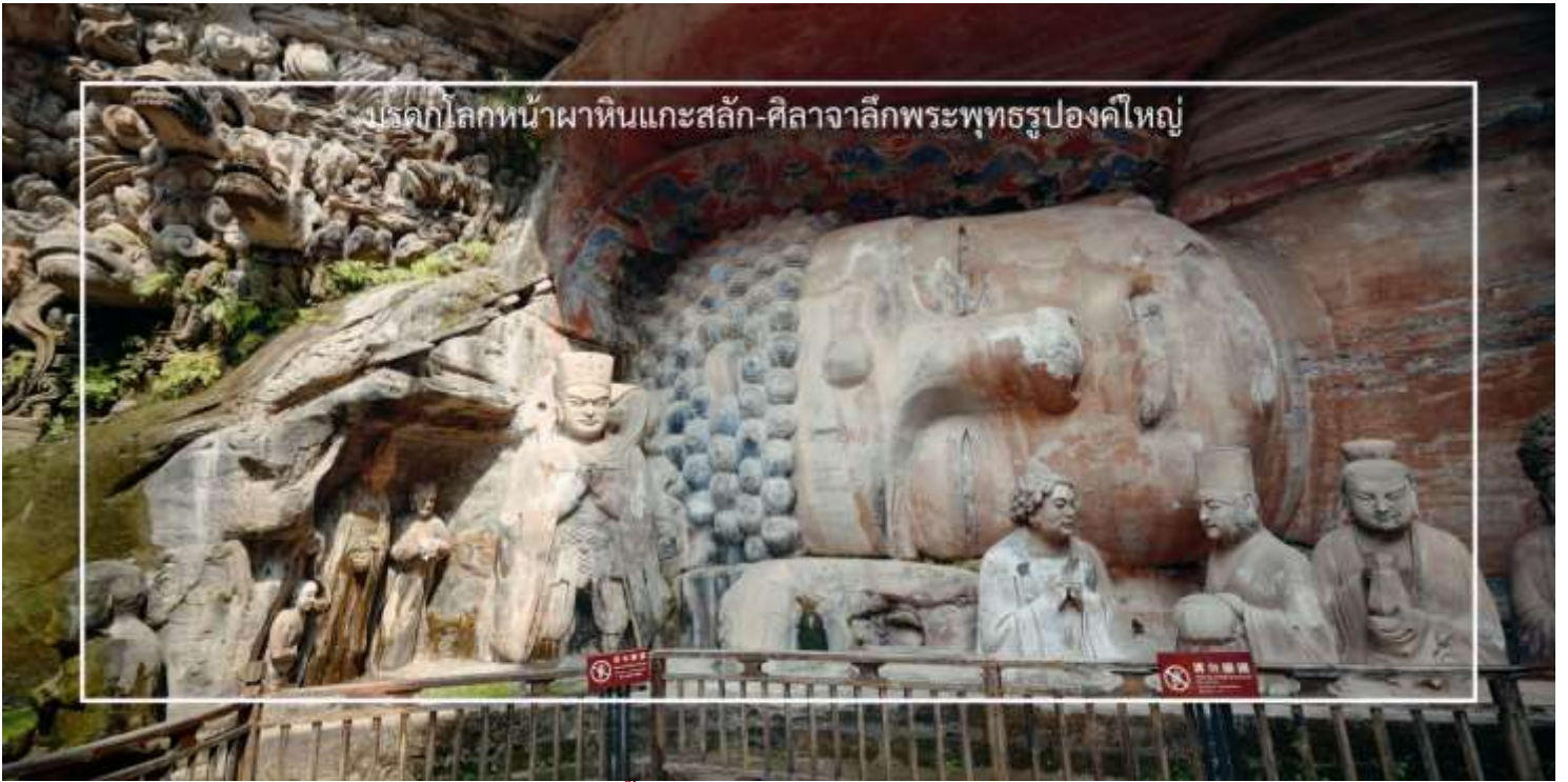
บรรดากลมหินหน้าผาหินแกะสลัก-ศิลาจากลึงพระพุทธรูปองค์ใหญ่