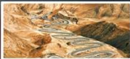
ถนนโบราณผืนหลงกู่เต้า