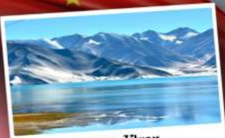
ทะเลสาบโปซาทุ

เปิดประตูสู่อารยธรรมพันปีแห่งซินเจียงใต้ ชมความสวยงามของหมู่บ้านดอกแอปเปิล