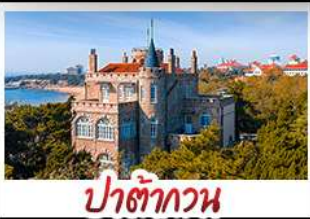
ป่าตักกวน

พระราชวังฤดูร้อน - วิวเมืองซิงเต่า รถไฟความเร็วสูง - ภูเขาเหลาซาน กำแพงเมืองจีนด้านจวียงกวน - ป่าตักกวน พักโรงแรมระดับ 4 ดาว - ไม่ลงร้านซื้อ! มือพิเศษ เปิดปักกิ่ง , หม้อไฟซีฟู้ด