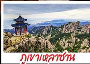
ภูเขาเหลาซาน