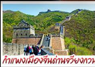
กำแพงเมืองจีนด้านจวียงกวน