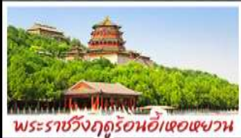
พระราชวังฤดูร้อนอี้เหอหยวน

ท่าแพงเมืองจีนค่ามจวียงกวน - พระราชวังฤดูร้อนอี้เหอหยวน สวนจึงอัน - วัดลามะ - โม่หลงร้านช้อป - โรงแรม 4 ดาว มือพิเศษ เปิดบิกทิ่ง สุทึ่มองโก MICHELIN GUIDE ร้าน TAO TAO JU