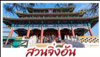
สวนจึงอัน