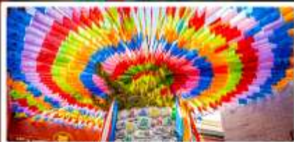
วัดลามะกว้างเหิน