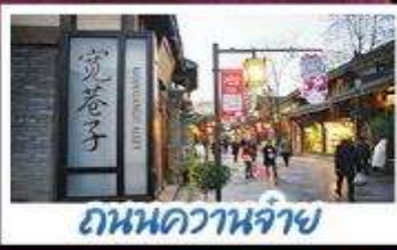
ถนนควานจ้าย