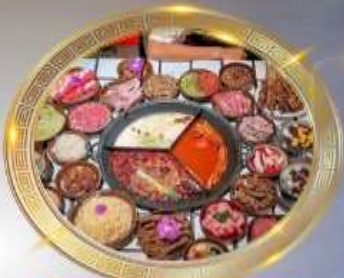
บุฟเฟต์ห่อมือไฟหลงซิ่ง