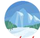
เทือกเขาคอร์เนอร์แกรต ชมวิวยอดเขาแมทเทอร์ฮอร์น

นำท่านเดินไปยังสถานีรถไฟ เพื่อนั่งรถไฟขึ้นสู่ เทือกเขาคอร์เนอร์แกรต (Gornergrat) (ใช้เวลาในการเดินทางประมาณ 15 นาที) รถไฟคอร์เนอร์แกรตเป็นรถไฟขึ้นภูเขาที่ตั้งอยู่ในรัฐวาเล ที่เชื่อมกับหมู่บ้านเซอร์แมท สถานีรถไฟคอร์เนอร์แกรต ให้ท่านถ่ายรูปตามอัธยาศัย ชมวิวยอดเขาแมทเทอร์ฮอร์น (Matterhorn) มงกุฎแห่งสวิตเซอร์แลนด์ นำท่านนั่งรถไฟคอร์เนอร์แกรตลงมาสู่ เมืองเซอร์แมท อิสระให้ท่านเดินชมเมืองเซอร์แมท และพักผ่อนตามอัธยาศัย นำท่านเดินทางสู่ เมืองทาช (Tasch) ด้วย Shuttle Train จากสถานีรถไฟเซอร์แมท สู่สถานีรถไฟทาช (ใช้เวลาในการเดินทางประมาณ 30 นาที)