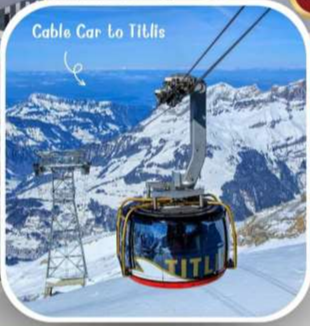
Cable Car to Titlis