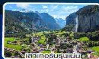
เลาเทออร์บรุนเนน