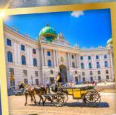
ฮอฟบวร์กเวียนนา