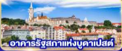
อาคารรัฐสภาแห่งบูดาเปสต์