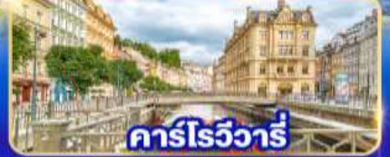
คาร์โรวัวร์