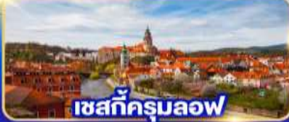
เซสท์ครุมลอฟ