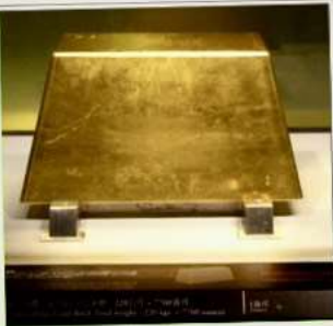
พิพิธภัณฑ์ทองคำ