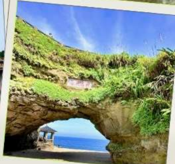
ถ้ำสี่หมื่น