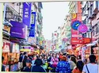
ถนนโบราณทันสมัย